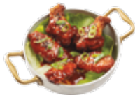
Chicken wings with explosive sauce 8,25€