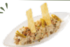
Insalata russa con tonno 6,25€