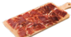
Prosciutto iberico di ghianda 15,50€