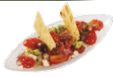
Russischer Salat mit Thunfisch 6,25€