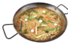
季節の野菜ごはん 19,75€