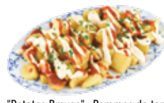
"Patatas Bravas", Pommes de terres frites servies avec une sauce légèrement piquante 5,75€