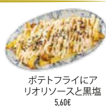
ポテトフライにアリオリソースと黒塩 5,60€