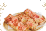
Toast de pain grillé et frotté à la tomate, sel et huile d'olives 2,25€