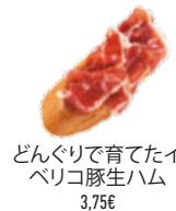
どんぐりで育てたイベリコ豚生ハム 3,75€