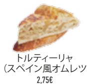
トルティーヤ (スペイン風オムレツ) 2,75€