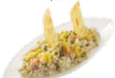
Pasta mit Gambas, Krebs und Ananas 7,35€