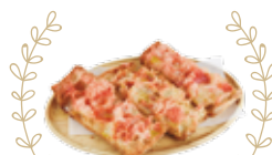
Brot mit Tomate 2,25€