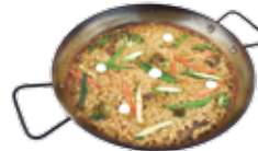
Reis mit Gemüse der Saison 19,75€