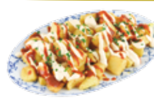
Patatas bravas-Bratkartoffeln mit „wilder Soße“ 5,75€