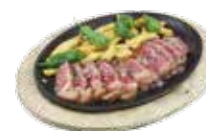
ビーフテンダーロインのグリル、ポテトとパドロンペッパーの盛り合わせ 13,50€