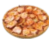
プルポ・ア・フェイラ (タコのガリシア風) 15,50€