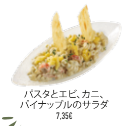
パスタとエビ、カニ、パイナップルのサラダ 7,35€