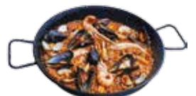
Paella de poisson et fruits de mer 21,25€