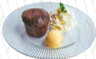
Belgian chocolate coulant with vanilla ice cream 5,25€