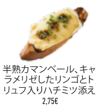
半熟カマンベール、キャラメリゼしたリンゴとトリュフ入りハチミツ添え 2,75€