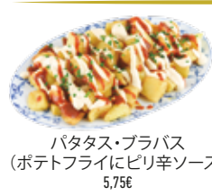
パタタス・ブラバス (ポテトフライにピリ辛ソース) 5,75€