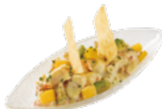
De Fruits de mer, dés d'avocat et de mangue 7,95€