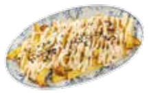
Thin potato slices with mild aioli and black salt 5,60€