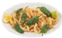
アンダルシア風イカのフライ 7,95€