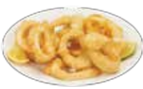
ヤリイカのフライにすりおろしたライム添え 8,95€