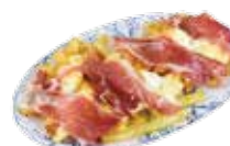
Zerstoßene Setzeier mit iberischem Eichelschinken 8,50€