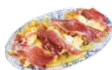
ポテトフライと目玉焼きにイベリコ豚生ハム 8,50€