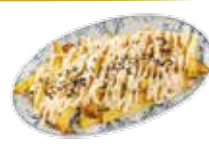
Feine Kartoffelchips mit sanfter Alioli-Soße und schwarzem Salz 5,60€