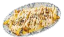
Patate con "alioli" e sale nera 6,15€