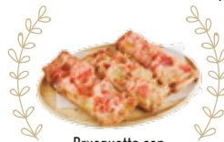
Brosquetta con pomodoro e olio 2,50€