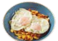
Uova con carne macinata iberica piccante 7,45€