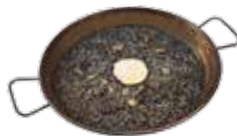
Cassolette de riz noir à la seiche, et son encre, à l'Allioli 18,25€