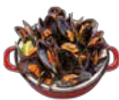
グリルしたムール貝の煮込み 6,95€