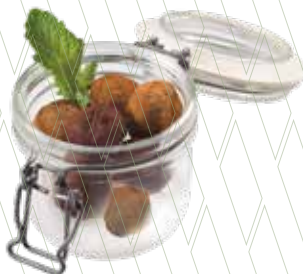
Artisan chocolate truffles 4,95€