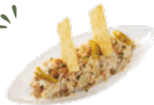
Russian salad with tuna 5,75€