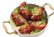
チキンの手羽に特製ソース 8,25€