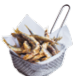
Pesciolini fritti 7,25€