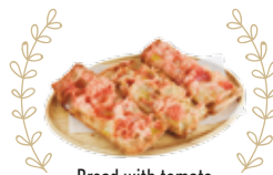
Bread with tomato 2,25€