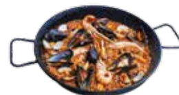
Paella mit Fisch und Meeresfrüchten 21,25€