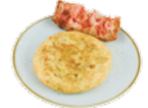
Kartoffelomelett, frisch zubereitet 6,15€