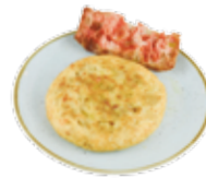
Frittata di patate fatta al momento 6,15€