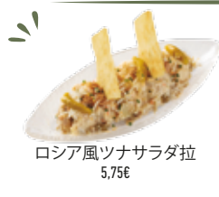
ロシア風ツナサラダラ 5,75€