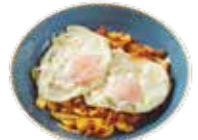
Uova con carne macinata iberica piccante 6,75€