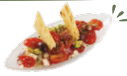
Insalata con pomodorie formaggio feta e avocado e olive nere 6,25€