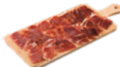
Jambon Ibérique de porc élevé aux glands 15,50€