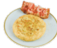
Frittata di patate fatta al momento 6,75€