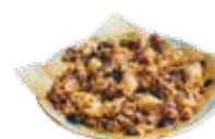
ホタルイカのフライにイカ墨入りアリオリソース添え 8,50€