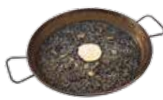
イカ墨パエリア(イカ入り)アリオリソース添え 18,25€