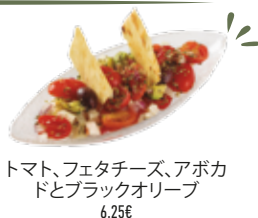
トマト、フェタチーズ、アボカドとブラックオリーブ 6,25€