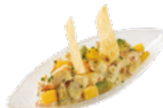
Insalata di frutti di mare con avocado e mango 7,95€