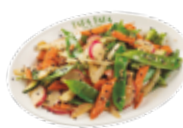
Wok di verdure di stagione con soia e sesamo 7,75€