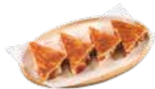
Tramezzino con mozzarella tartufo e prosciutto iberico 6,75€