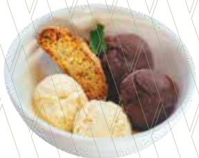
Artisan vanilla and Belgian chocolate ice cream duo by Sandro Desii 4,95€