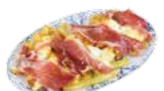
Uova strapazzate con prosciutto iberico di ghianda 9,35€