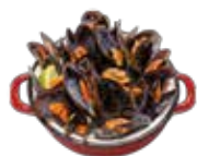
Tonschale mit Miesmuscheln vom Planchablech 6,95€