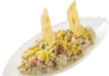
Pasta with shrimps, crab and pineapple 7,35€