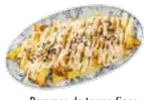
Pommes de terres fines et frites servies avec une sauce d'ail et huile d'olives, et copeaux de sel noir 5,60€