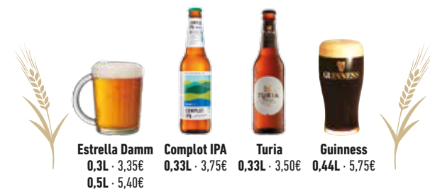
Estrella Damm 0,3L · 3,35€ 0,5L · 5,40€