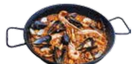
Paella di pesce e frutti di mare 22,95€