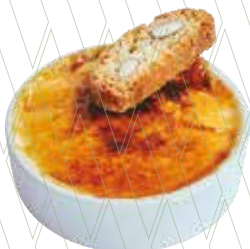
Catalan crème brûlée with biscotti 5,25€