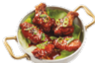
Ali di pollo con salsa piccante 8,25€