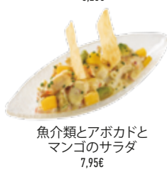
魚介類とアボカドとマンゴのサラダ 7,95€