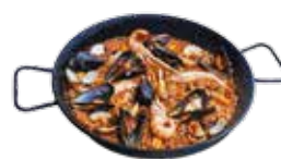
シーフードパエリア 21,25€