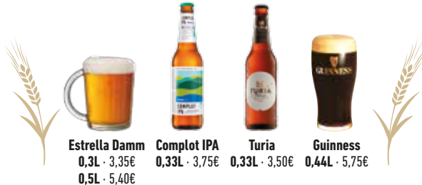
Estrella Damm 0,3L · 3,35€ 0,5L · 5,40€