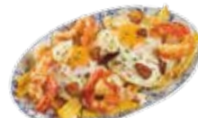
Uova strapazzate con gamberetti e alio 9,05€