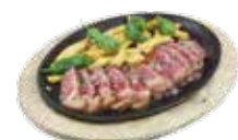
Lombo di manzo alla griglia con patate e peperoni verdi 13,50€