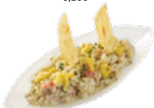
Insalata di pasta con gamberetti e mango e maionese 8,15€