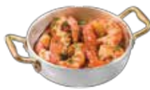
エビのアヒーリオ 9,50€