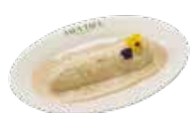
Cannelloni classici con bechamel tartufata 6,50€