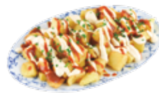
Patate "bravas" con salsa piccante 5,75€