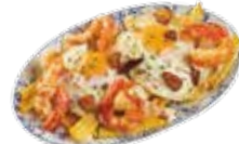
Fried eggs and potatoes with garlic shrimps 8,25€