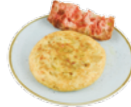
Freshly made potato omelette 6,15€