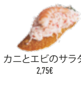
カニとエビのサラダ 2,75€