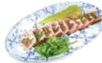
マグロのたたき、ワカモレとワカメ添え 8,75€