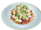
マグロ、マンゴー、アボカドのタルタル 8,75€