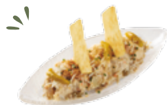
Macédoine de légumes à la mayonnaise, au thon, poivrons rouges et œuf de caille 5,75€