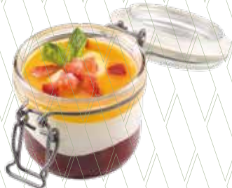
Yoghurt cream with red and passion fruits 5,25€