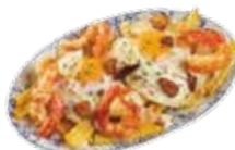
星型卵のガーリックシュリンプ添え 8,25€