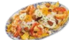
Sterneneier mit Knoblauchgarnelen 8,25€