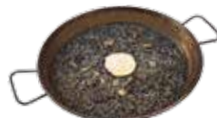
Risotto al nero di seppie con "alioli" 20,25€