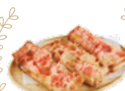
Bruschetta con pomodoro e olio 2,25€