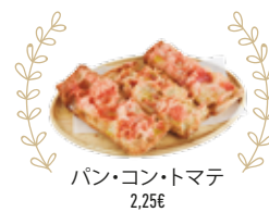
パン・コン・トマテ 2,25€