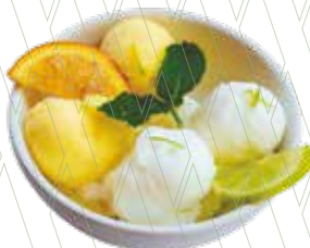
Citrus sorbets duo by Sandro Desii 4,95€