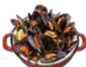
Cozze alla griglia 7,65€