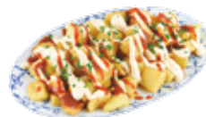
Patate "bravas" con salsa piccante 6,30€