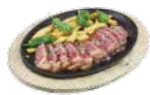
Grilled beef tenderloin with potatoes and Padrón peppers 13,50€