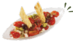
Tomates cerises, feta, dés d'avocat et olives noire 6,25€