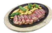
Faux-filet de boeuf grillé avec des pommes de terre et petits piments verts de "Padrón" 13,50€