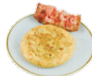
作りたてトルティーヤ (スペイン風オムレツ) 6,15€