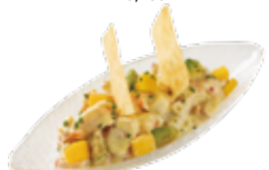
Meeresfrüchte, Avocado und Mango 7,95€