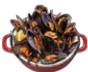
Grilled mussel casserole 6,95€