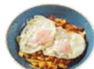
ポテトフライと目玉焼きにアリオリソースとブラバソースとイベリコ豚生ハムのチョップ 6,75€