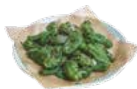
Peperoni piccoli verdi "del Padron" 5,15€