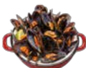
Cozze alla griglia 6,95€