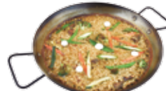
Risotto con verdure di stagione 21,50€