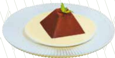
Pecat de xocolata belga amb crema anglesa 5,45€