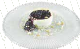
Pastís de formatge amb confitura de nabius 5,45€