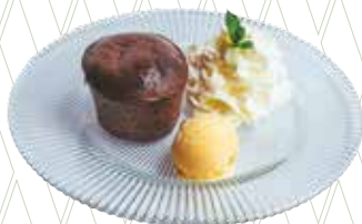
Coulant de xocolata belga amb gelat de vainilla 5,45€