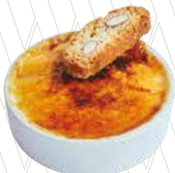
Crema catalana amb carquinyoli 5,45€