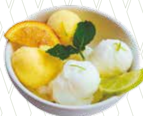
Duo de sorbets cítrics Sandro Desii 5,05€