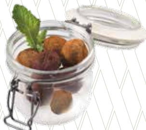
Trufes artesanes de xocolata 5,05€