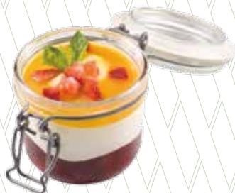
Cremós de iogurt amb fruits vermells i fruita de la passió 5,45€