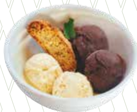
Duo de gelats artesans de vainilla i xocolata belga 5,05€